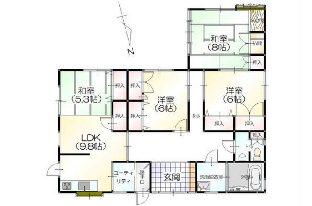
※図面と現況が異なる場合、現況優先になります。