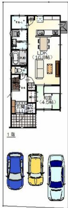
※プラン図面の為施工途中で変更の可能性があります