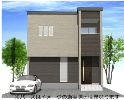
※パースはイメージの為実際とは異なります

〒929-0327 石川県津幡町字庄へ57番19より分筆 右棟 - [3.3.0G]