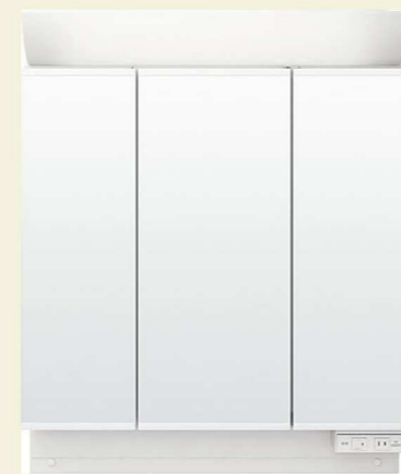
3面鏡(全収納・蛍光灯照明) 間口750mm MAR1-753TX

5cm刻みでトレイ位置を移動して高さを自由にアレンジできます。 入れるものの高さにぴったり合わせられるので、 無駄なスペースをつくりません。