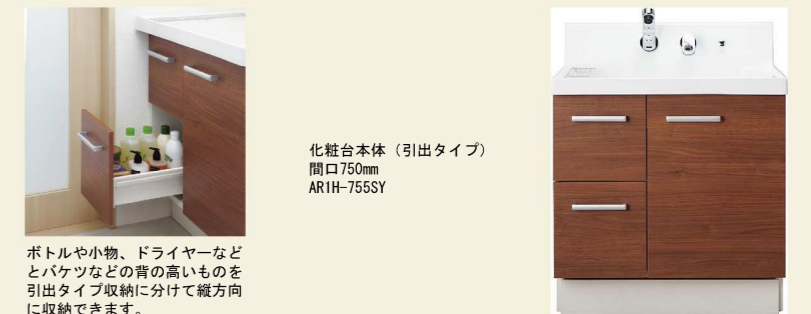
化粧台本体(引出タイプ) 間口750mm AR1H-755SY

ボトルや小物、ドライヤーなど とバケツなどの背の高いものを 引出タイプ収納に分けて縦方向 に収納できます。